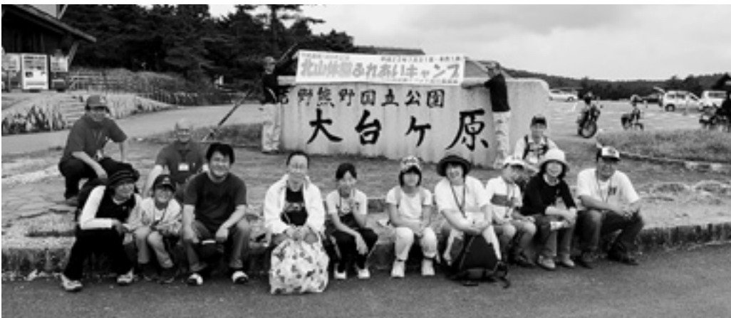
登山後の一枚！ みなさん 大変お疲れ様でした！

池郷川でのあまごのつかみどりや、竹を使っての飯ごう炊飯、竹とんぼ教室や流しそうめん、キャンプファイヤーを行いました。 2日目には上北山村・北山村のコースに分かれ、上北山村では大台ヶ原散策、北山村では筏下りを楽しみました。 両日とも晴天に恵まれ、参加者の笑顔がとても印象的でした。