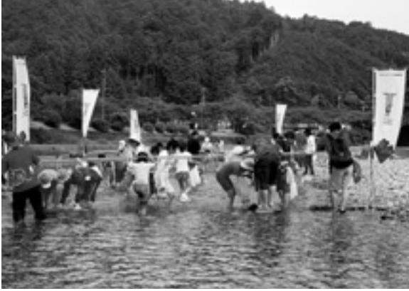
一生懸命魚を追いかけます！

1日目は下北山スポーツ公園キャンプ場を舞台とし、アウトドアライフを満喫して頂く為、テント設営からスタート。